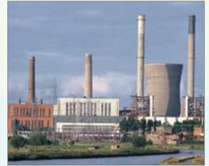
Electrabel investeert fors in de milieuvriendelijkheid van zijn centrale in Ruien.

Om te voldoen aan nieuwe strenge Europese milieunormen moest de elektriciteitscentrale van Ruien zijn rookgaszuiveringsinstallatie grondig vernieuwen. Voor die renovatie deed eigenaar Electrabel een beroep op Fabricom-GTI. Dat klopte op zijn beurt aan bij Phoenix Contact voor elektronische vermogensrelais die hoge schakelfrequenties toelaten, een groot vermogen hebben en nagenoeg slijtvast zijn.