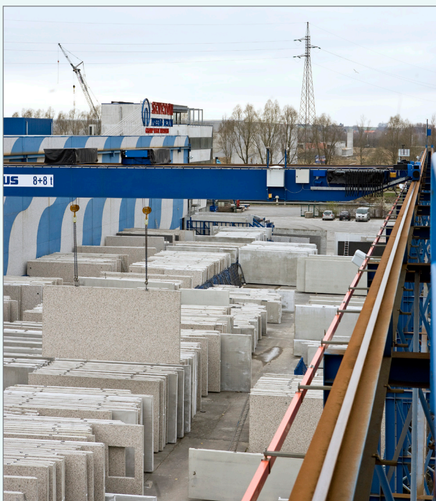
Het gps-systeem op de twee kranen kan de plaats van de platen bepalen.

Is Bluetooth wel geschikt voor een industriële omgeving? Steven Van Cauwenberghe: "Absoluut. Bluetooth bestaat in verschillende vermogensklassen. Klasse I heeft een vermogen van 100 milliWatt en kan hierdoor afstanden van meer dan 100 meter overbruggen. En nog een voordeel van Bluetooth is dat het als open standaard ook probleemloos met andere Bluetooth-toestellen van andere producenten kan communiceren, zoals de handscanner."