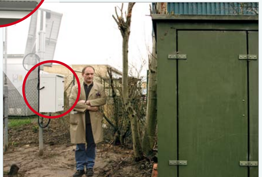
Dankzij de draadloze oplossing waren graafwerken rond de hoogspanningscabine overbodig.