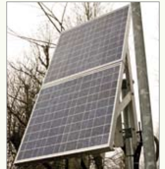
Zonnepanelen zorgen voor autonome installatie: dag en nacht.

Voor het automatisch rapporteren en opslaan van verbruikscijfers van gas en water was Lano Carpets op zoek naar een performante én betaalbare draadloze oplossing. Phoenix Contact stelde een opstelling voor met twee gekoppelde sets van draadloze multiplexers met Bluetoothtechnologie.