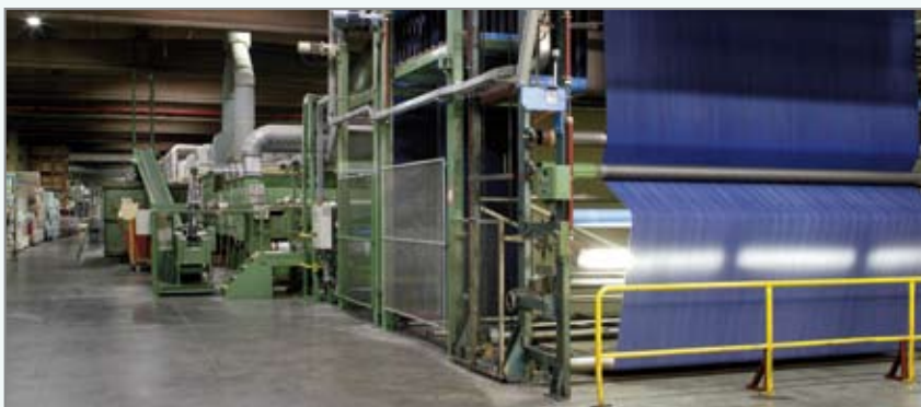
Lano te Harelbeke is trendsetter in toepassingen met kunstgras.

Graven in een zone met verhoogd explosiegevaar is not done. Zelfs een kabel voor de stroomvoorziening was problematisch.