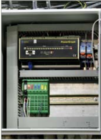
Draadloze multiplexer geïnstalleerd bij de Powergraph energieregistrator.