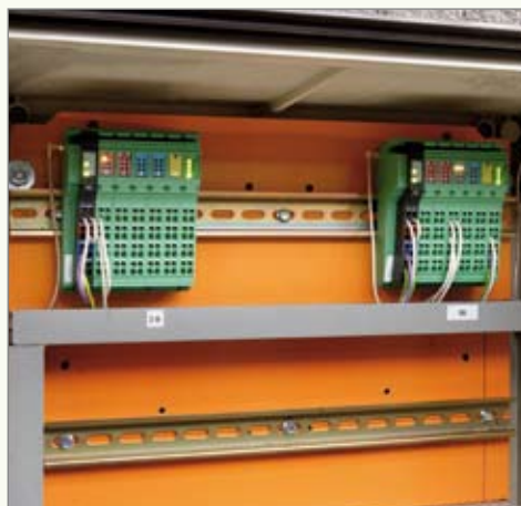
Pomphuis is draadloos verbonden met het gasverdeelstation en met de energieregistrator.

Op de beurs werd afgesproken om bij Lano ter plaatse een test te doen met Wirelex MUX, dat zijn draadloze multiplexers op basis van Bluetooth-technologie . Een Wireless MUX kan zestien digitale en twee analoge signalen bidirectioneel doorsturen over een afstand van enkele honderden meters. De testopstelling werkte goed. De deal werd gesloten.