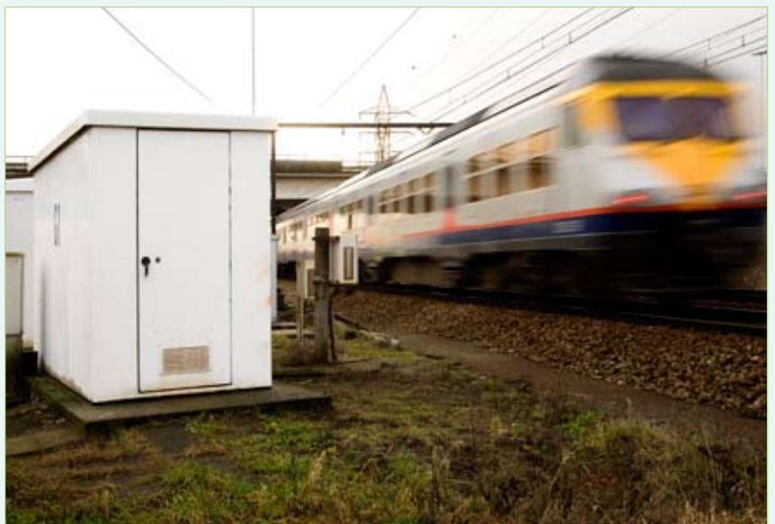
Honderden PLP-loges langs het spoorwegnet staan in voor de aansturing van signalisatie, slagbomen, wissels, het interne gsm-net voor machinisten enz.

voorzien die bij een eventueel uitvallen van voeding én noodvoeding (in de AC-kast) een autonomie van 3 uur garanderen: voldoende tijd voor een interventie. Die batterijen zijn geïnstalleerd in het DC-gedeelte . De 400/230V AC van de eerste kast wordt er via verschillende redundant opgestelde gelijkrichters omgezet in 48V DC-spanning als voeding voor de batterijopladers. In de DC-kast worden meteen ook