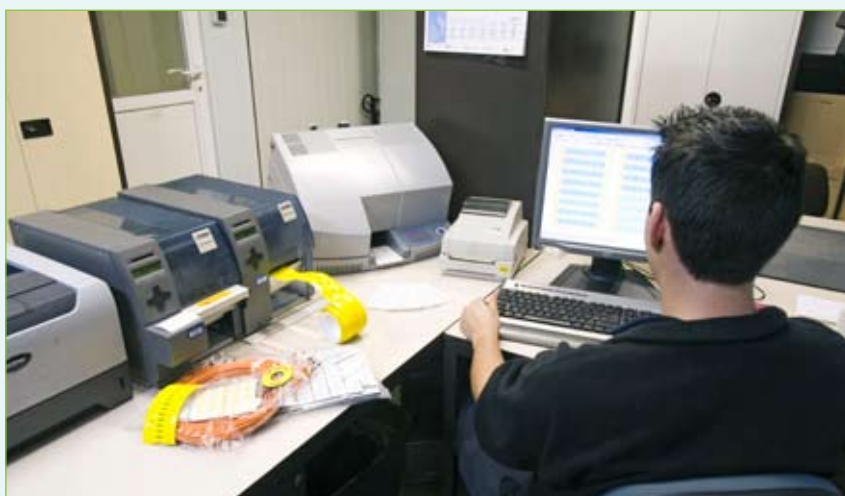
In de codeerkamer van P&V staan een Bluemark-printer voor schildjes en verschillende Thermo-XI-printers voor zelfklevende etikettes, allebei van Phoenix Contact.

"De identificatie van kabels, draden en klemmen verloopt zo goed als automatisch."