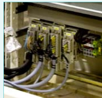
Phoenix Contact levert voor de PLP-commutatieborden steekbare Heavycon-connectoren die de feilloze verbindingen tussen de verschillende kasten garanderen.

Phoenix Contact levert voor de PLP-commutatieborden behalve de overspanningsbeveiliging ook QTCU-snelaansluitklemmen, ST- en ST-Combi-veerdrukklemmen en steekbare Heavycon-connectoren die de feilloze