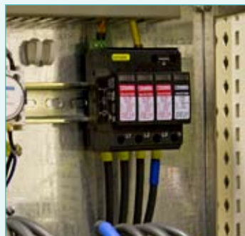
Uiteraard is er overspanningsbeveiliging voorzien.

Een ander voordeel van P&V is dat ze alle kasten vóór de levering uitgebreid testen op hun complete functionaliteit. "De kasten worden dus plug & play geleverd. Hun installatie is daardoor sneller en eenvoudiger. De tests zijn ook een garantie voor de bedrijfszekerheid van het geheel."