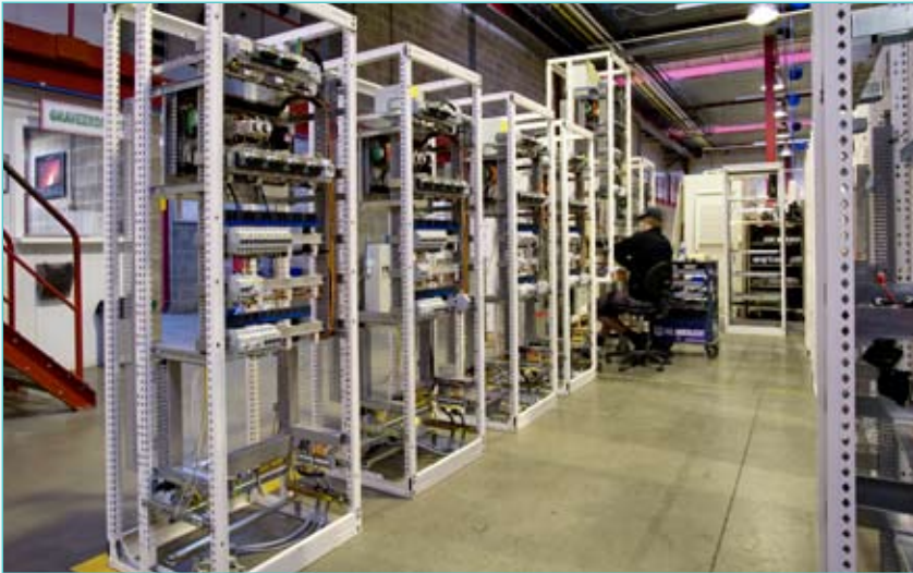
De commutatieborden zijn telkens verdeeld over 2, 3 of 4 verschillende kasten, hier in de productiehal van P&V.

al een hele reeks kritieke verbruikers van stroom voorzien. Bovendien bevat de kast een meet- en controle-eenheid (MCU) die continu diverse parameters registreert: de laadstroom van de batterijen, het DC-verbruik enz. Infrabel kan via internet alle registraties monitoren van op afstand en zo zeer snel ingrijpen als zich een probleem voordoet.